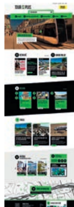
Maquette du futur site

L'architecture du site est délibérément simple et comporte un nombre limité d'entrées pour plus de lisibilité et de confort de navigation. De façon à accompagner les usages de consultation, le site est développé pour être aussi bien consulté sur ordinateur que sur tablette ou smartphone. L'accent est également mis sur l'accessibilité puisque le site répond aux normes les plus exigeantes.