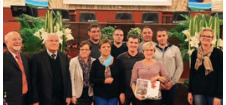
Les agents de la Mairie de Luynes entourés des élus et des représentants de l'ARF Centre lors de la remise de la Fleur.

L'ASSOCIATION RÉGIONALE POUR LE FLEURISSEMENT ET L'EMBELLISSEMENT DES COMMUNES (ARF CENTRE) A DÉCERNÉ UNE DEUXIÈME FLEUR À LA VILLE DE LUYNES POUR LA QUALITÉ ET LE BON ENTRETIEN DE SES ESPACES VERTS.