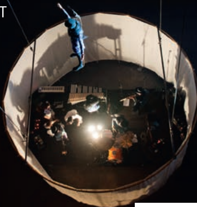
La performance de l'artiste MOPA.