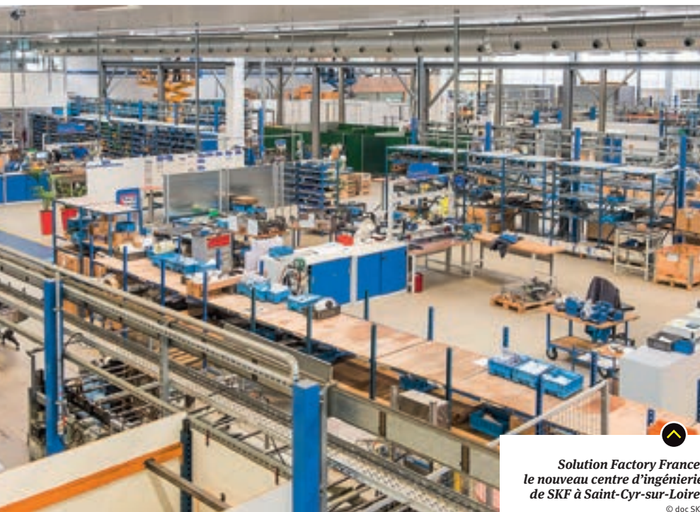
Solution Factory France, le nouveau centre d'ingénierie de SKF à Saint-Cyr-sur-Loire.