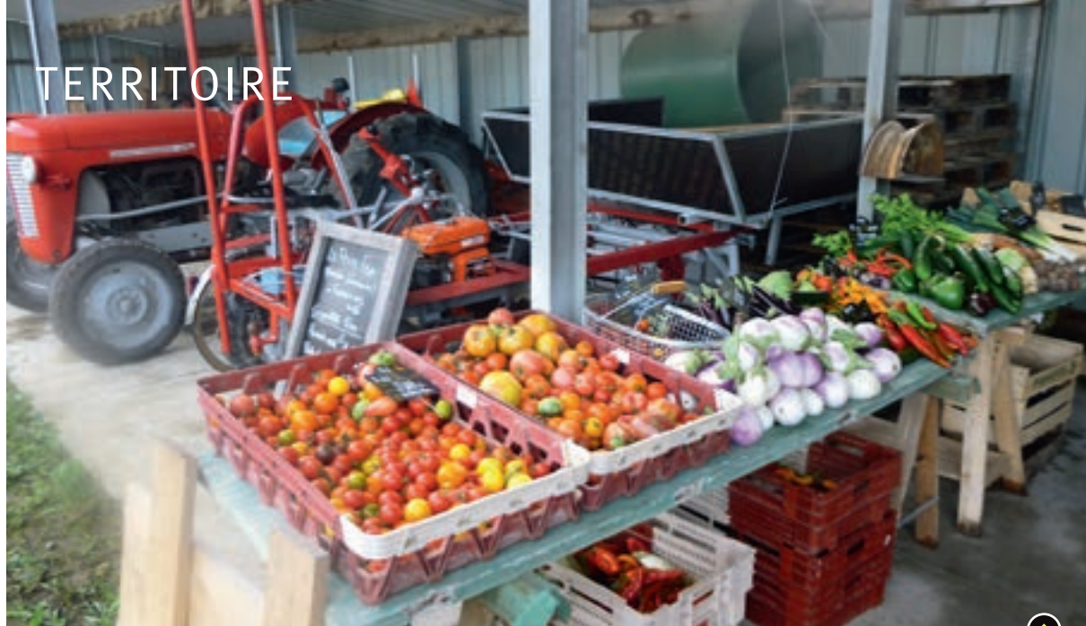
Fruits et légumes vendus sur place.