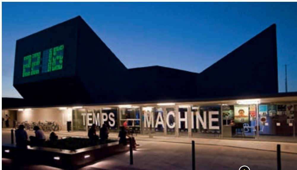
Le Temps Machine, la nuit.