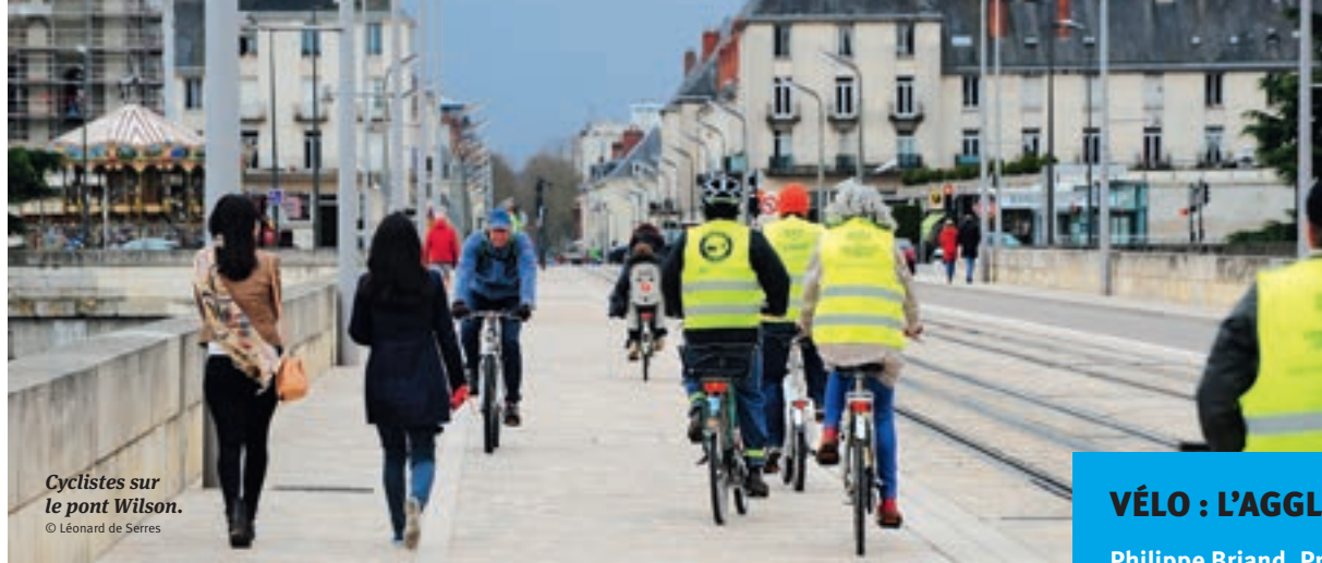
Cyclistes sur le pont Wilson.