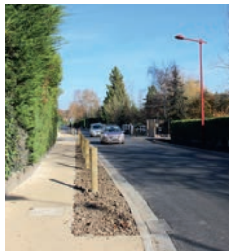
La rue du Maréchal Juin

Sans réduire le stationnement, la nouvelle place offrira un parvis plus ouvert et convivial pour accéder à la mairie et des aires de jeux et de verdure à proximité de l'accueil périscolaire et de l'ancienne mairie. Elle proposera des espaces plus vastes pour l'installation des deux marchés hebdomadaires et le nouveau sens de circulation permettra un accès optimisé au centre, à ses commerces et services, et une sortie simplifiée notamment pour repartir vers le boulevard du Général de Gaulle. Toujours dans le but de faciliter les déplacements, la rue du Maréchal Juin est, elle aussi, en train de subir