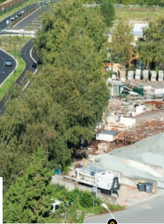
L'avenue du Prieuré à La Riche, requalifiée en 2014.