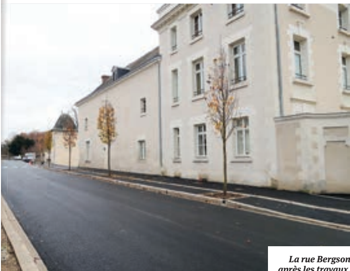
La rue Bergson après les travaux.

La partie est de la rue Henri-Bergson, entre la rue François-Rabelais et le boulevard Charles-de-Gaulle, a fait l'objet d'un aménagement complet entre 2003 et 2010. Seule sa section ouest, entre la rue Rabelais et la rue de la Croix de Périgourd, restait à requalifier. Une partie de rue très empruntée puisqu'elle permet d'accéder au pôle culturel de La Clarté où l'on trouve l'école municipale de musique et l'atelier de recherche en art contemporain. L'entreprise Eiffage Travaux Publics a engagé les travaux d'aménagement de voirie. Outre des travaux