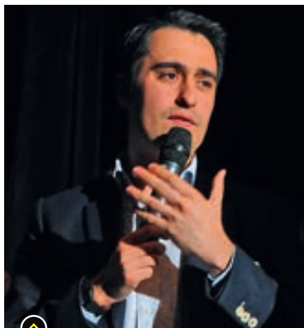
Lors de l'inauguration du POINT H'UT en avril 2015.

Il faut citer également le travail accompli par le Théâtre Olympia, scène régionale qui devrait devenir nationale,