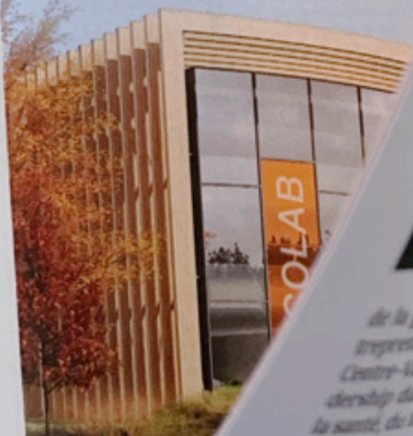
La Boltardière, part d'activité de la zone