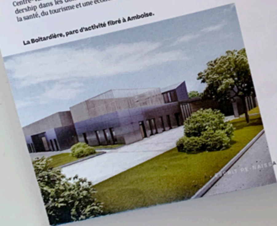
La Boltardière, parc d'activité fibré à Amboise.

A vec plus de 110 000 m 2 commercialisés pour 209 transactions, les résultats 2018 étaient très proches du niveau record observé en 2017. La baisse des stocks combinée à un marché de transactions qui se réalisent sans délai. Malgré ce marché extrêmement dynamique, les prix sont stables et compétitifs vis-à-vis des marchés d'autres métropoles. L'année 2019 confirme cette tendance avec un nombre de transactions réalisées très élevé dès le premier semestre. L'attractivité du territoire doit beaucoup à son environnement exceptionnel. À proximité immédiate des richesses culturelles et artistiques du Val de Loire, Cité internationale de la gastronomie, Tours offre en outre un écosystème favorable à l'entrepreneuriat : 1 er pôle d'enseignement et 1 er bassin d'emploi de la région Centre-Val de Loire, 22 000 entreprises, cinq pôles de compétitivité, un leadership dans les domaines de l'énergie, des services à la personne, de la santé, du tourisme et une économie numérique en plein développement.