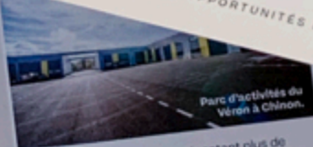
Parc d'activités du Véron à Chinon.

C'est la plus grande surface placée sur le marché tertiaire en 2018. Il s'agit des immeubles de l'opération Hermione dans le quartier des 2 Lions à Tours