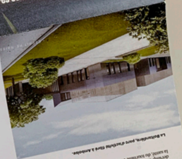
La Bortulière, parc d'activités situé à Amboise.

Hors-série Spécial opportunités d'implantation Nos offres foncières et immobilières