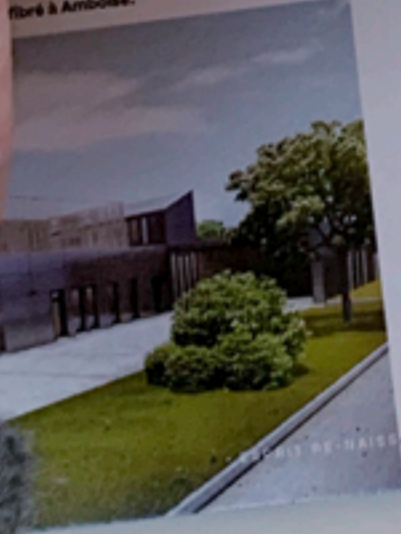
quartier des 2 Lions à Tours