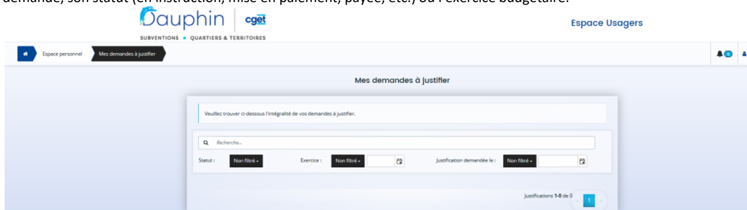
Figure 2 : interface des demandes à justifier

Avec la nouvelle interface proposée ci-dessous, vous pourrez, filtrer les subventions à justifier sur le nom de la demande, son statut (en instruction, mise en paiement, payée, etc.) ou l'exercice budgétaire.