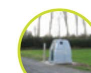
Rue de la Rabinière Levée du Cher

DÉCHETS VÉGÉTAUX > Les jeudis matins 09/01, 23/01, 06/02 et 20/02 puis tous les jeudis du 05/03 au 31/12/2020