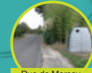
Rue de Marsay (à côté des serres de Travouillon)