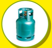
BOUTEILLES DE GAZ