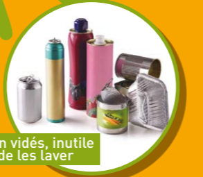
BOÎTES, BIDONS, AÉROSOLS ET CANETTES MÉTALLIQUES