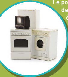
Collecte réservée aux particuliers. LITERIE, GROS MOBILIER ET ÉLECTROMÉNAGER

Les gros encombrants présentés sur le trottoir (ex : mobilier, literie, électroménager) sont collectés uniquement sur rendez-vous obtenu au 02 47 80 12 12