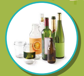
BOUTEILLES, BOCAUX ET POTS EN VERRE

POUR LA TRANQUILLITÉ DU VOISINAGE PAS DE DÉPÔT ENTRE 20H ET 8H