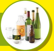
VERRE ET BOUTEILLES