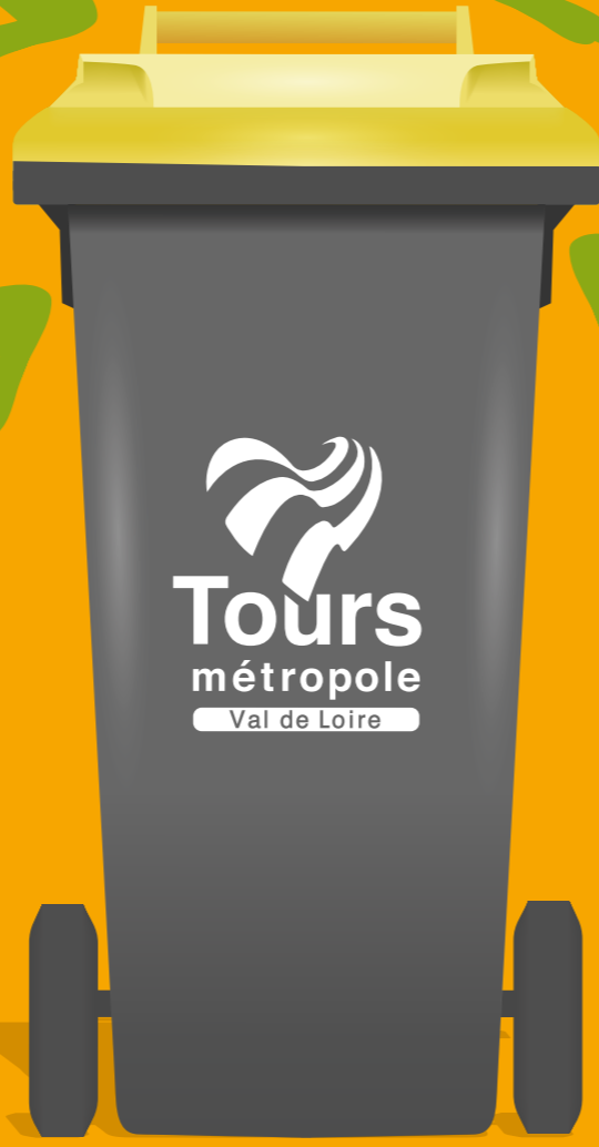
Bien vidés, inutile de les laver

LES DÉCHETS SUIVANTS NE VONT PAS DANS LE BAC JAUNE, MAIS SONT À JETER :