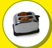
PETITS APPAREILS ÉLECTRIQUES