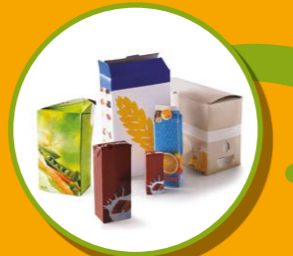
BRIQUES ALIMENTAIRES ET CARTON CARTONNETTES

JE METS UNIQUEMENT LES EMBALLAGES ET TOUS LES PAPIERS DANS LE BAC À COUVERCLE JAUNE, EN VRAC