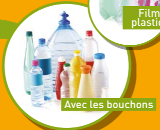
BOUTEILLES ET FLACONS VIDES EN PLASTIQUE