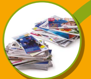
TOUS LES PAPIERS