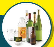
VERRE ET BOUTEILLES