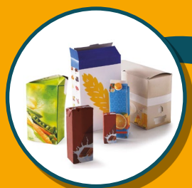
BRIQUES ALIMENTAIRES ET CARTON CARTONNETTES

JE METS UNIQUEMENT LES EMBALLAGES ET TOUS LES PAPIERS DANS LE BAC À COUVERCLE JAUNE, EN VRAC