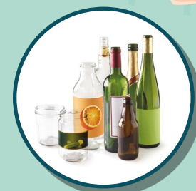
BOUTEILLES, BOCAUX ET POTS EN VERRE

POUR LA TRANQUILLITÉ DU VOISINAGE PAS DE DÉPÔT ENTRE 20H ET 8H