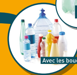
BOUTEILLES ET FLACONS VIDES EN PLASTIQUE