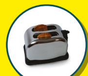
PETITS APPAREILS ÉLECTRIQUES