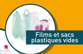
Films et sacs plastiques vides