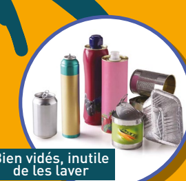
Bien vidés, inutile de les laver