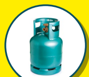
BOUTEILLES DE GAZ