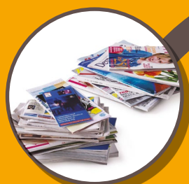
TOUS LES PAPIERS