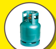
BOUTEILLES DE GAZ