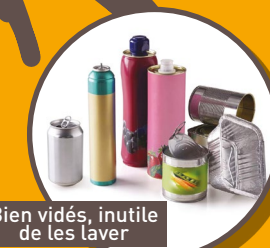
Bien vidés, inutile de les laver