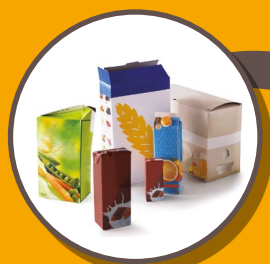
BRIQUES ALIMENTAIRES ET CARTON CARTONNETTES

JE METS UNIQUEMENT LES EMBALLAGES ET TOUS LES PAPIERS DANS LE BAC À COUVERCLE JAUNE, EN VRAC