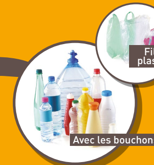
BOUTEILLES ET FLACONS VIDES EN PLASTIQUE