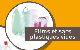
Films et sacs plastiques vides