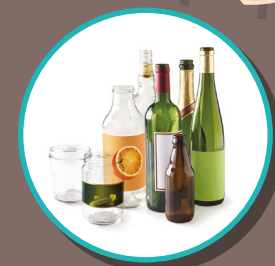
BOUTEILLES, BOCAUX ET POTS EN VERRE

POUR LA TRANQUILLITÉ DU VOISINAGE PAS DE DÉPÔT ENTRE 20H ET 8H