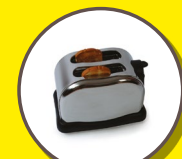
PETITS APPAREILS ÉLECTRIQUES