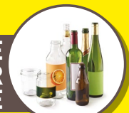
VERRE ET BOUTEILLES