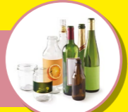
VERRE ET BOUTEILLES