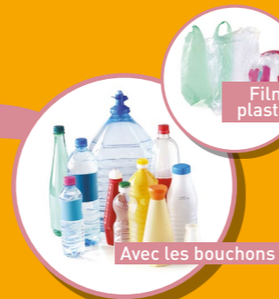
BOUTEILLES ET FLACONS VIDES EN PLASTIQUE