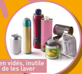
Bien vidés, inutile de les laver