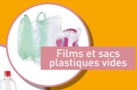
Films et sacs plastiques vides