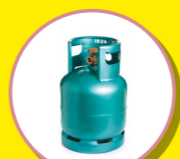
BOUTEILLES DE GAZ