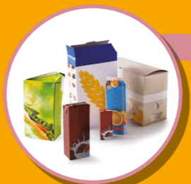
BRIQUES ALIMENTAIRES ET CARTON CARTONNETTES

JE METS UNIQUEMENT LES EMBALLAGES ET TOUS LES PAPIERS DANS LE BAC À COUVERCLE JAUNE, EN VRAC