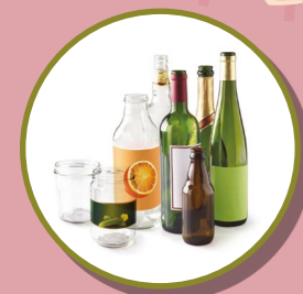
BOUTEILLES, BOCAUX ET POTS EN VERRE

POUR LA TRANQUILLITÉ DU VOISINAGE PAS DE DÉPÔT ENTRE 20H ET 8H