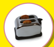
PETITS APPAREILS ÉLECTRIQUES