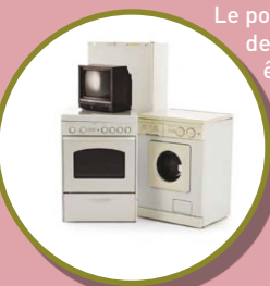
LITERIE, GROS MOBILIER ET ÉLECTROMÉNAGER