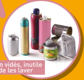
BOÎTES, BIDONS, AÉROSOLS ET CANETTES MÉTALLIQUES