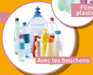
BOUTEILLES ET FLACONS VIDES EN PLASTIQUE