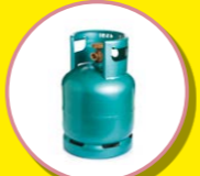
BOUTEILLES DE GAZ