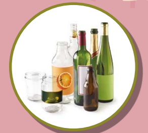
BOUTEILLES, BOCAUX ET POTS EN VERRE

POUR LA TRANQUILLITÉ DU VOISINAGE PAS DE DÉPÔT ENTRE 20H ET 8H