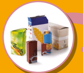
BRIQUES ALIMENTAIRES ET CARTON CARTONNETTES

JE METS UNIQUEMENT LES EMBALLAGES ET TOUS LES PAPIERS DANS LE BAC À COUVERCLE JAUNE, EN VRAC