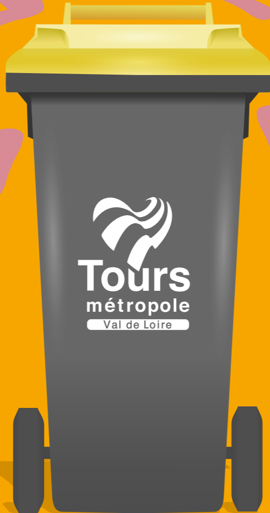
Bien vidés, inutile de les laver

LES DÉCHETS SUIVANTS NE VONT PAS DANS LE BAC JAUNE, MAIS SONT À JETER :