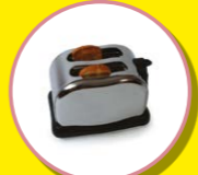
PETITS APPAREILS ÉLECTRIQUES