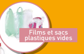
Films et sacs plastiques vides