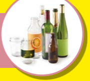
VERRE ET BOUTEILLES