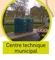
Centre technique municipal

● CONTENEURS COLLECTIFS À VERRE Pour la tranquillité du voisinage, pas de dépôt entre 20h et 8h.