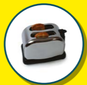
PETITS APPAREILS ÉLECTRIQUES