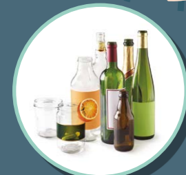
BOUEILLES, BOCAUX ET POTS EN VERRE

POUR LA TRANQUILLITÉ DU VOISINAGE PAS DE DÉPÔT ENTRE 20H ET 8H