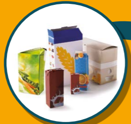
BRIQUES ALIMENTAIRES ET CARTON CARTONNETTES

JE METS UNIQUEMENT LES EMBALLAGES ET TOUS LES PAPIERS DANS LE BAC À COUVERCLE JAUNE, EN VRAC