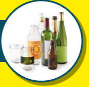
VERRE ET BOUEILLES