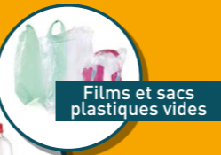
Films et sacs plastiques vides