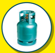
BOUEILLES DE GAZ