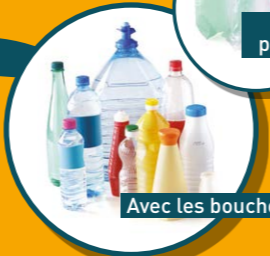
BOUEILLES ET FLACONS VIDES EN PLASTIQUE