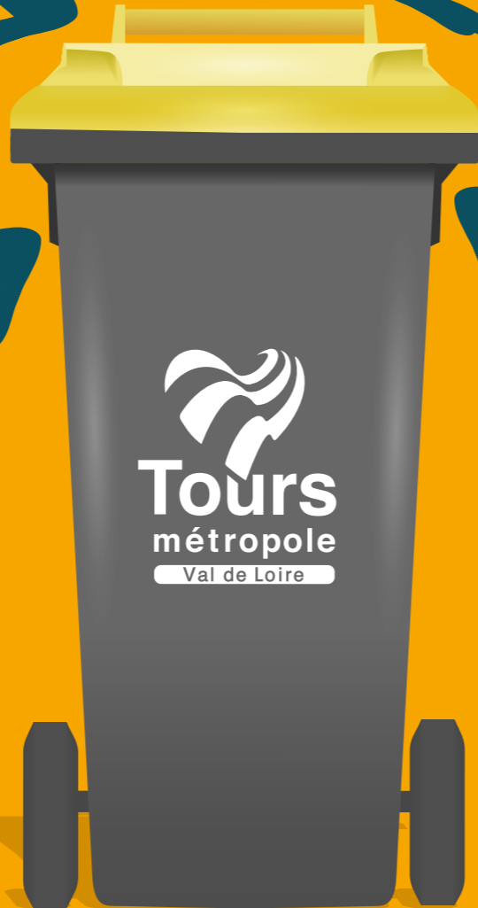
Bien vidés, inutile de les laver

LES DÉCHETS SUIVANTS NE VONT PAS DANS LE BAC JAUNE, MAIS SONT À JETER :