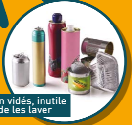
BOÎTES, BIDONS, AÉROSOLS ET CANETTES MÉTALLIQUES